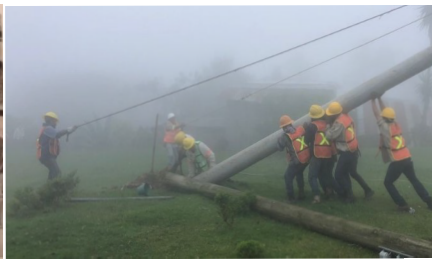
Imagen tomada durante la atención del Hurracán Grace, México (2021)