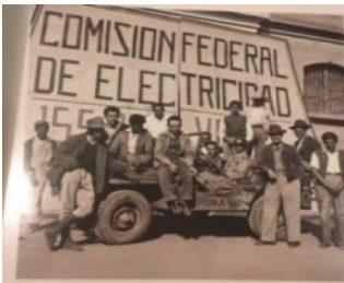
Imagen tomada en la inauguración de la electrificación rural en Tomatlán, Jalisco (1941)